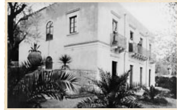
La "Villa Schuler" nel 1905