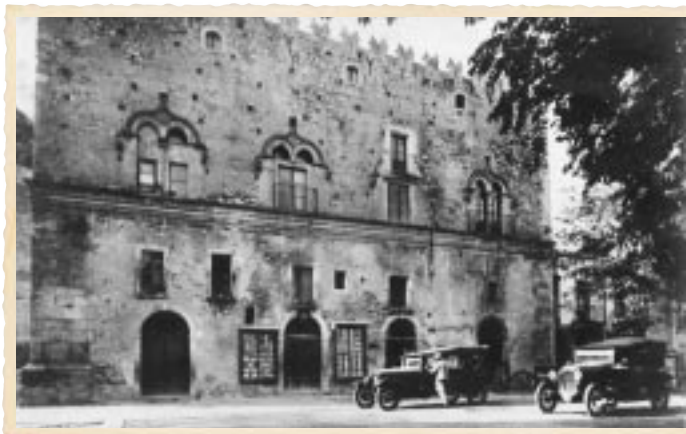
Taormina – Palazzo Corvaja