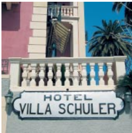
L'insegna dell'hotel "Villa Schuler" ha più di cento anni! E' una delle insegne del negozio a Palazzo Corvaja, vedi pag. 11

accanto alla Piazzetta Bastione, lo stesso meraviglioso angolo di Taormina nel quale ci auguriamo stiate trascorrendo un piacevole soggiorno. La casa che egli vi costruì era concepita originariamente come residenza per la sua famiglia. Fece inoltre allestire un ampio locale al pianoterra adibito a negozio e deposito di mobili antichi. Sicuramente egli guardava al futuro con ottimismo: una giovane famiglia, una casa meravigliosa in un paesaggio da sogno ed un rinomato negozio che andava bene. Questa felicità purtroppo, non durò a lungo: nostro bisnonno Eugen morì giovane nel 1905, a soli 39 anni. ☞